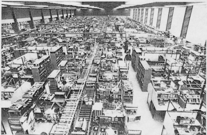
Een kijkje in een van de productiehallen.

De introductie van de televisie in Noorwegen kwam Tandberg eveneens goed van pas. Men was in straat direct met een TV-ontvanger te komen, waardoor men een belangrijk marktaandeel verkreeg. Uiteraard zijn dit maar enkele facetten van de totale Tandberg produktie. Zoals velen weten, maakt men tegenwoordig een compleet audioprogramma: versterkers, afstemmer-versterkers (receivers), bandrecorders, cassetterecorders en geluidsheergerers. En degenen die geregeld testrapporten lezen weten ook, dat de meeste