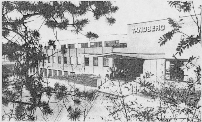
De entree van een van de nieuwere fabrieksgebouwen van Tandberg in Oslo.

De afgelopen acht jaar werden talloze fabrieken bezocht; in Nederland, Europa en andere delen van de wereld. Opmerkelijk is altijd weer dat er enorme verschillen zijn. Niet alleen natuurlijk tussen de diverse produktiemethoden, maar juist in de wijze van werken. Dat verschil is wel heel sterk bij vergelijking van een Japanse en een Europese fabriek. Maar nu bij Tandberg waren er toch aspecten die we nooit eerder waren tegengekomen in een Europese fabriek. Afgezien van de moderne produktiemethoden, is ook de hele sfeer anders. Alles gaat er zeer sociaal; zelfs zo, dat vakbonden niets of vrijwel niets hebben te maken met Tandberg.