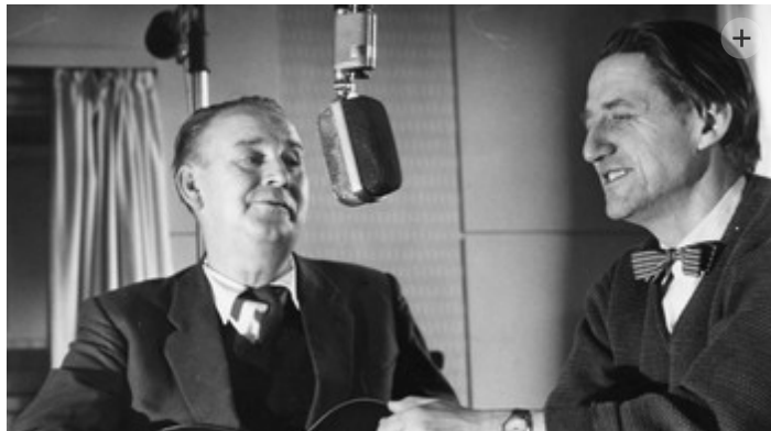
BARNETIMEN: Navnet Tandberg vekker garantert minner om lytting til Barnetimen. Her Alf Prøysen og Torbjørn Egner.